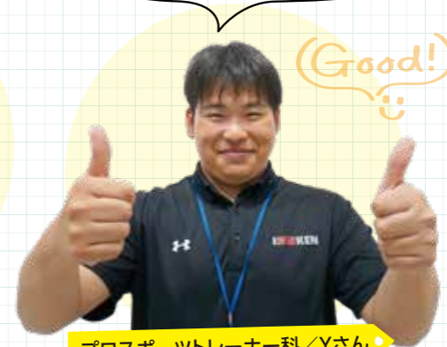
プロスポーツトレーナー科/Yさん